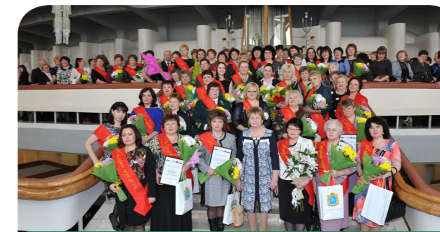
Женщина Самарской области 2014

В 2015 году Союз женщин Самарской области и Областной центр социальной помощи семье и детям проводят зональный этнофестиваль «Наше достояние - национальная семья» для жителей Приволжского, Безенчукского, Шигонского, Сызранского муниципальных районов и городских округов Сызрани и Октябрьска.