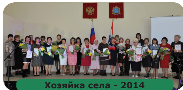
Хозяйка села - 2014

Самарская областная организация Профсоюза, конечно, и раньше уделяла внимание