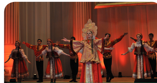
Женщина Самарской области 2013

службой занятости, ежегодных ярмарок вакансий рабочих мест и других мероприятий.